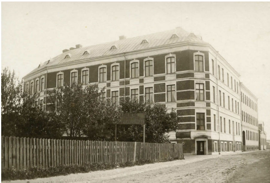
KULTURMINNE. Lokförarehuset på Öster är väl bevarat och har anor sedan tidigt 1900-tal.