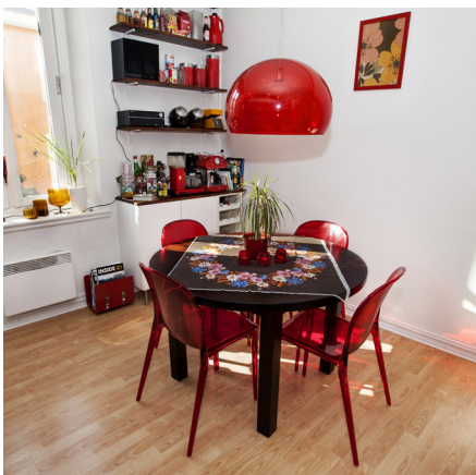
LÄCKER DESIGN. Bordet i köket är billigt inropat på auktion och därefter egenhändigt slipat, betsat och lackat.