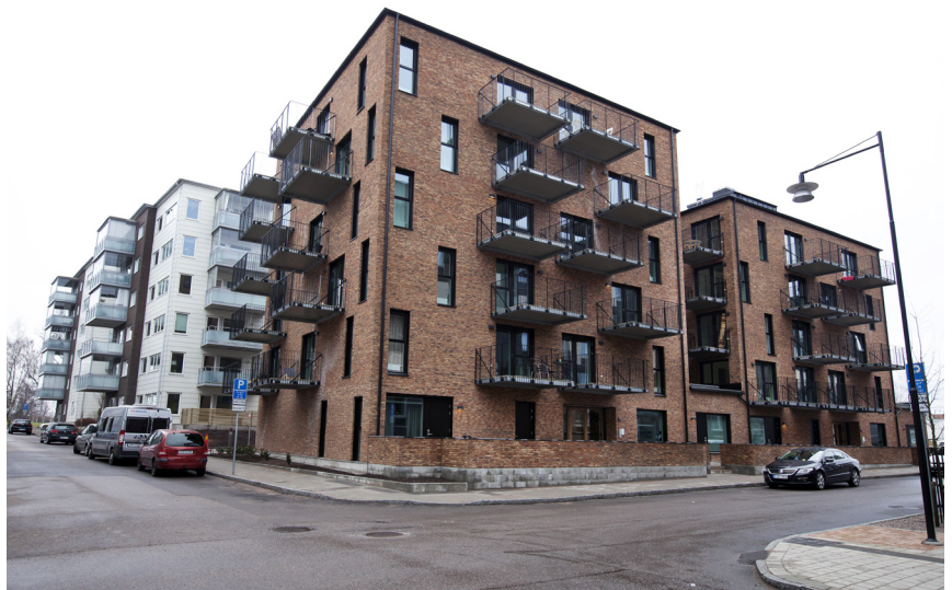
LANDMÄRKE. Järneken med sin vackra tegelfasad och spännande arkitektur fångar blicken när man passerar Nissastrand.

– Jag har kollat runt och gjort en lista på vad jag behöver, nu köper jag sakerna lite allt eftersom. Jag har verkligen väntat på det här. Den senaste tiden har jag bott i Hyltebruk, men det är här i Halmstad jag har alla mina vänner. Här känner jag mig hemma. ■