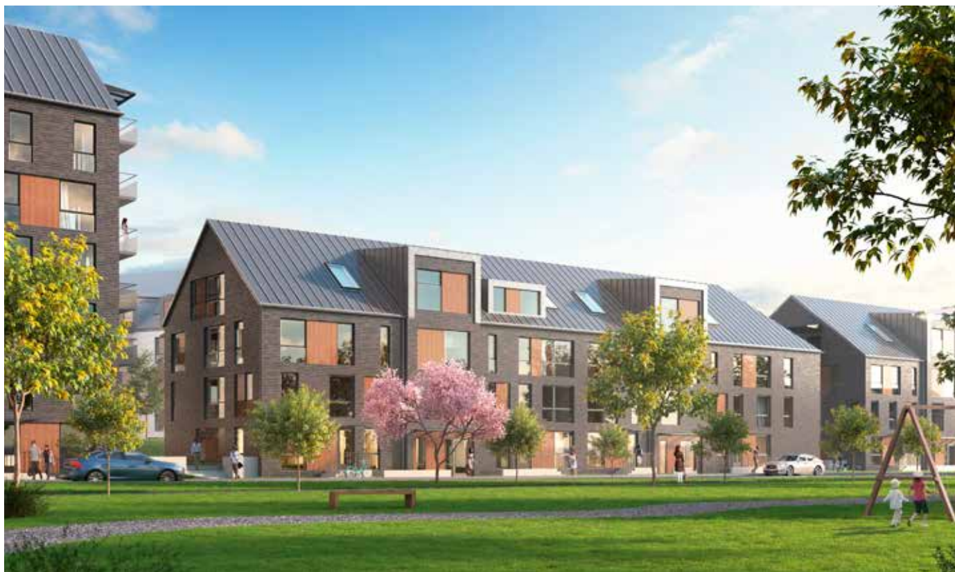
Kvarteret Borgen med lägenheter med egen ingång från Södra vägen.